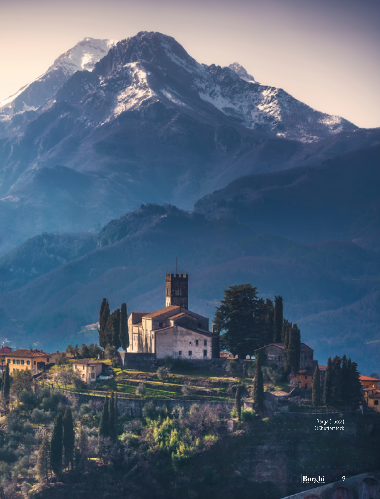
Barga (Lucca)