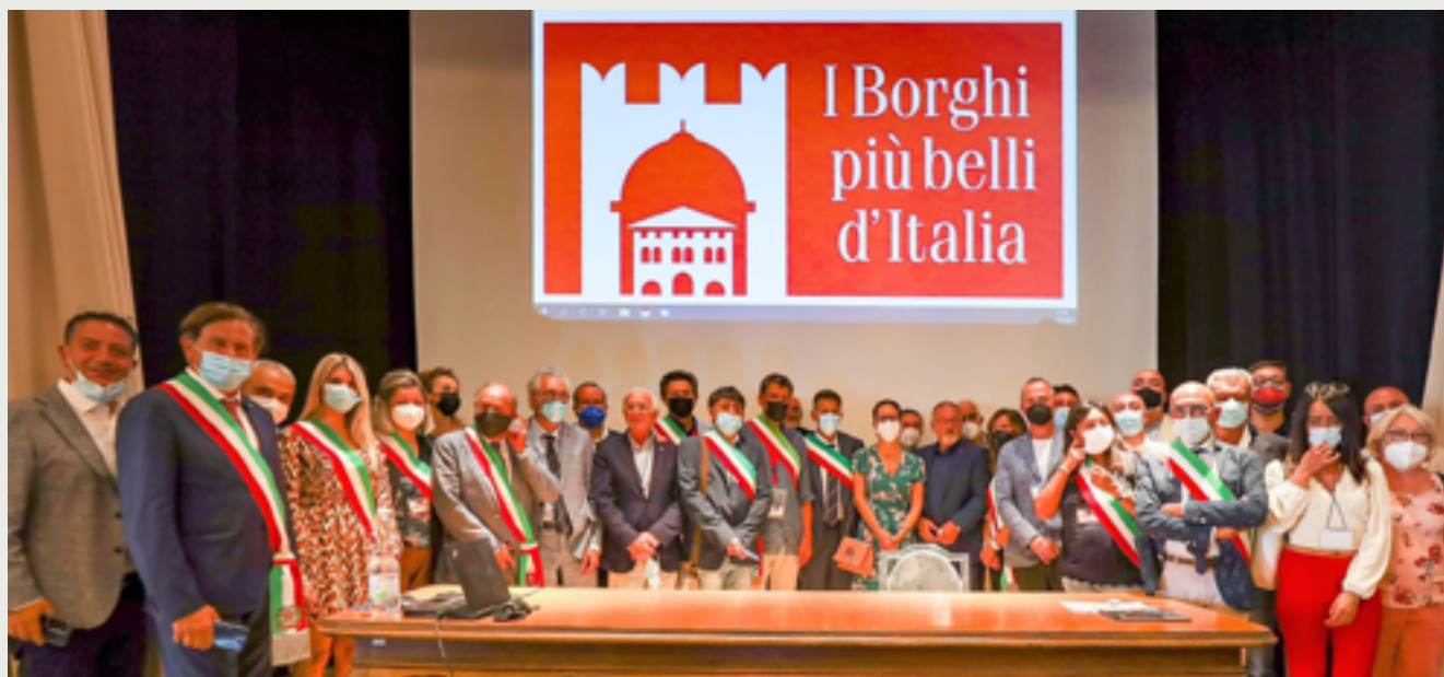
Foto di gruppo dei sindaci dei Borghi più belli d'Italia a Gardone Riviera

Una grande soddisfazione per tutto il mondo dei Borghi.