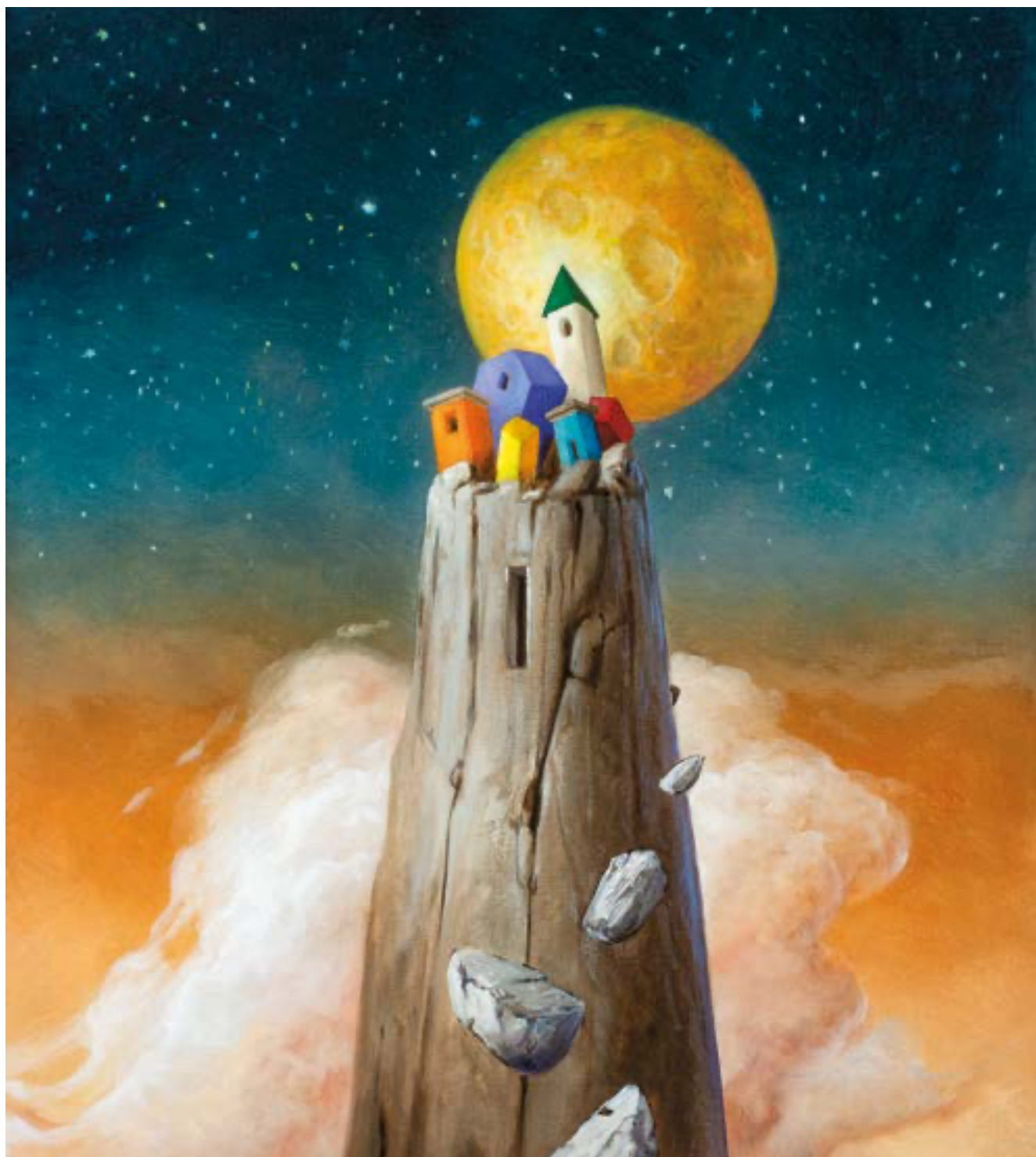
Ciro Palumbo, Piccolo borgo , 2021, olio su tela ©Ciro Palumbo/Galleria Punto sull'Arte