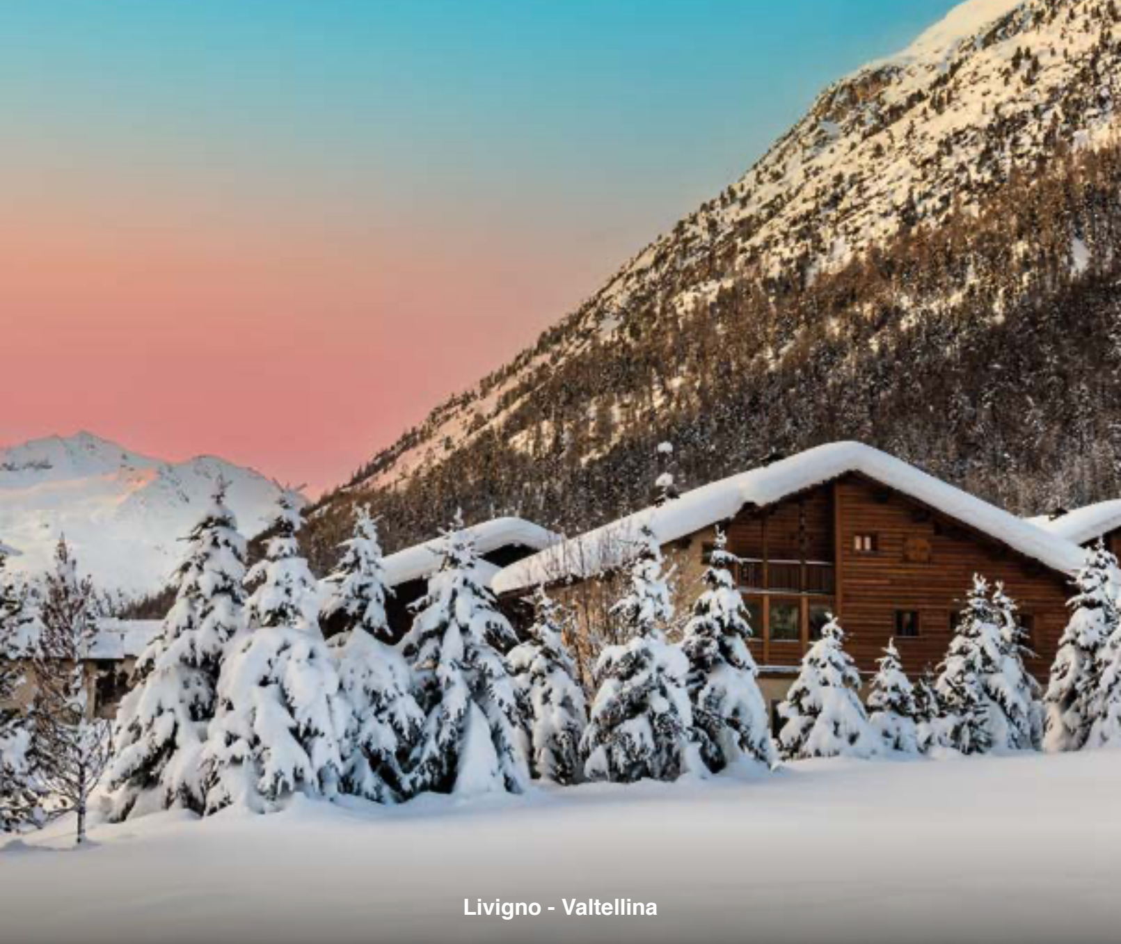
Livigno - Valtellina