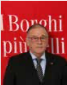
Fiorello Primi PRESIDENTE DEI BORGHI PIÙ BELLI D'ITALIA

I Borghi più belli d'Italia e Slow Food Italia hanno firmato lo scorso gennaio un protocollo d'intesa con cui si impegnano a collaborare per dare visibilità con azioni comuni alle buone pratiche italiane nell'ambito della tutela della biodiversità biologica e culturale, dell'educazione al gusto e delle politiche alimentari. In particolare, le due associazioni si impegnano a promuovere i prodotti locali di qualità, a sostenere le piccole aziende agroalimentari e a favorire lo sviluppo di modelli di produzione, distribuzione e consumo sostenibili, nonché ad aiutare i comuni nell'individuazione di iniziative di valorizzazione dei sistemi alimentari locali. I Borghi parteciperanno alle manifestazioni internazionali di Slow Food, quali Terra Madre Salone del Gusto, Cheese, Slow Fish, realizzando spazi di comunicazione dei progetti.