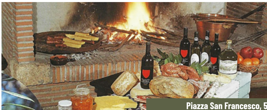
Piazza San Francesco, 5