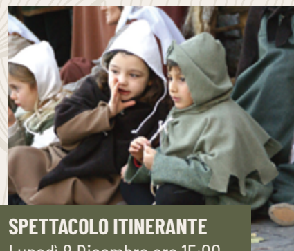
SPETTACOLO ITINERANTE Lunedì 8 Dicembre ore 15:00

Come ogni anno l'atteso Corteo Storico vi aspetta l'8 dicembre. Il corteo storico è la rievocazione della Charta Libertatis da parte di Ildebrandino VIII conte degli Aldobrandeschi di Sovana, fatta ai "fedeli sudditi" suveretani nel lontano 1201. Un centinaio di figuranti sfilano per le vie del borgo in abiti del 1200 , accompagnati da musicisti e giocolieri che si esibiranno davanti al Conte.