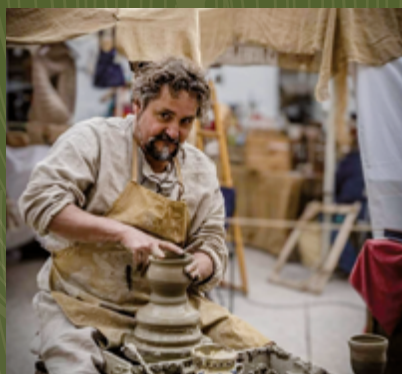
Piazzetta San Martino

LABORATORIO DI CERAMICA | 30 Novembre LA PICCOLA FORNACE MEDIEVALE | 7 e 8 Dicembre