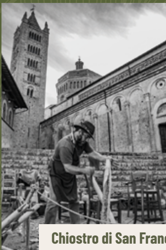
Chiostro di San Francesco | 7 e 8 Dicembre