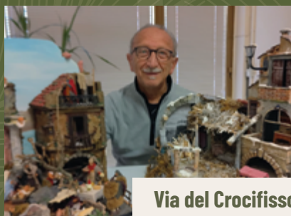
Via del Crocifisso

Ogni sua opera è un atto d'amore verso la cultura presepistica napoletana, un omaggio alla storia e alla bellezza di un'arte che merita di essere tramandata.